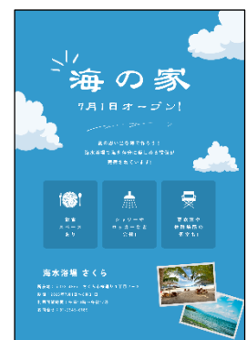
【ポストカード作成例】