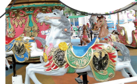
写真サイズ: 8cm×8cm 解像度350px カンバスサイズ: 9cm×10cm