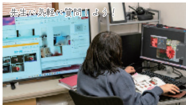
先生に気軽に質問しよう!