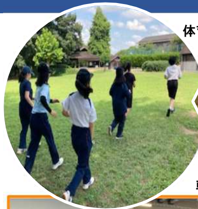
体育トレーニング