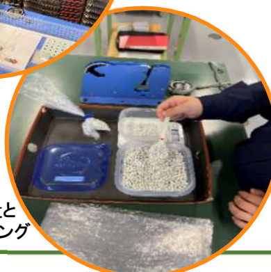
計量と パッキング